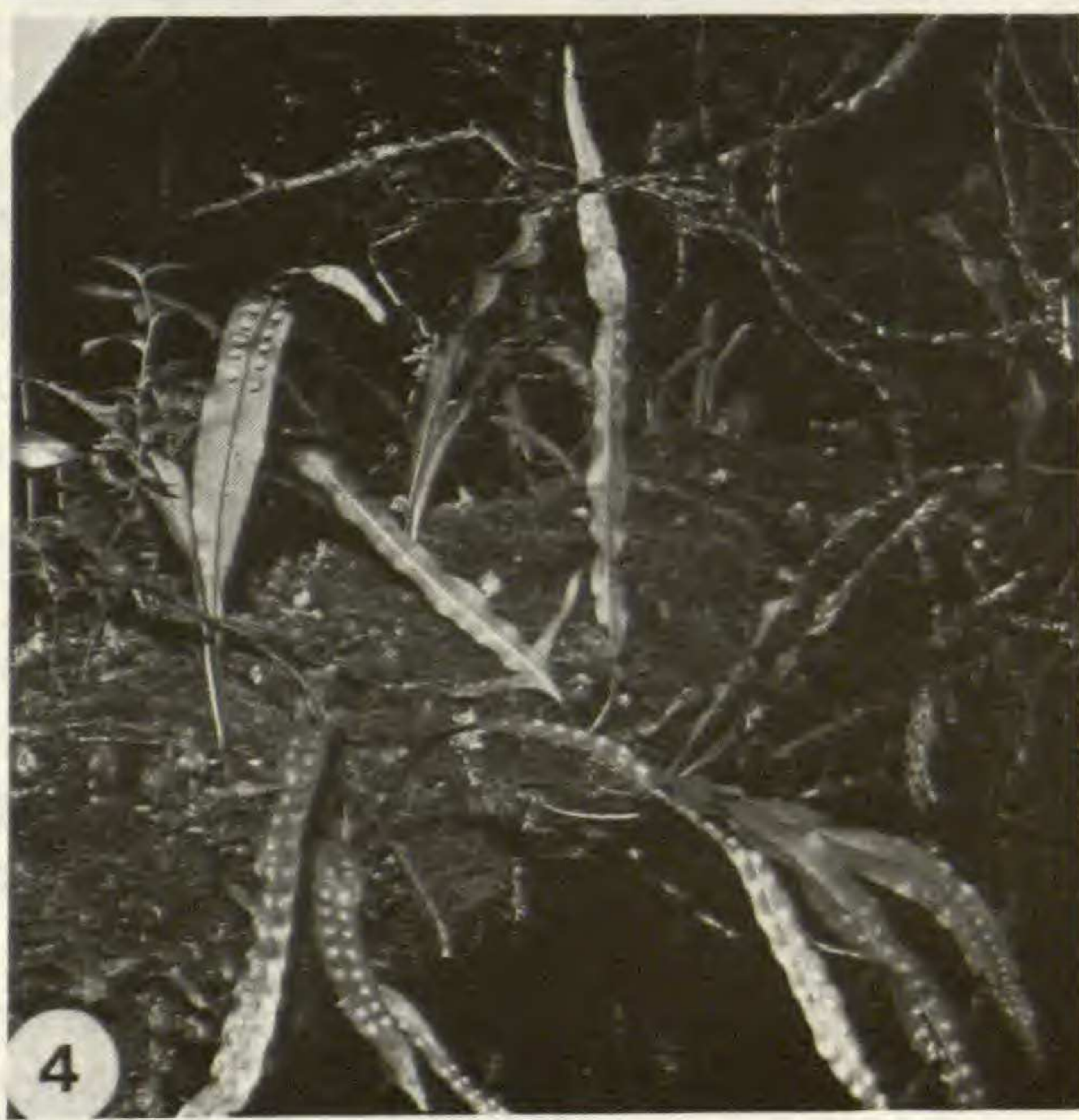
Pl. 1. — 1, Réserve d'Ambohitantely, « forêt à mousse et sous-bois herbacé » (PERRIER DE LA BÂTHIE) ; formation des plateaux ; 2, Nephrolepis undulata (Afzel. ex Sw.) J. Sm., épiphyte sous la couronne de feuilles de Pandanus sp. ; 3, Trichomanes speciosum Willd., ici épiphyte au bord d'un cours d'eau ; 4, Lepisorus excavatus (Bory ex Willd.) Ching, épiphyte sur un vieux tronc couché dans le sous-bois.