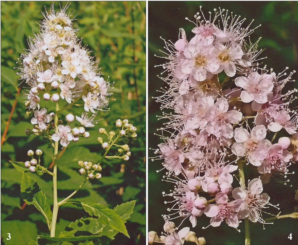
Abb. 3, 4: Spiraea alba var. latifolia , verlandeter Graben W Tylsen. – 3: Breit pyramidaler Blütenstand. 22.06.2019. – 4: Blütenstand mit anfangs rosa getönten Blüten. 13.07.2020.