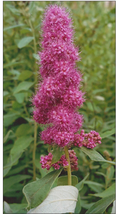
Abb. 7: Spiraea douglasii var. douglasii : kompakter, mehr zylindrischer Blütenstand, unten die weißfilzige Blattunterseite sichtbar. Mischwald SO Tylsen, 26.06.2020.