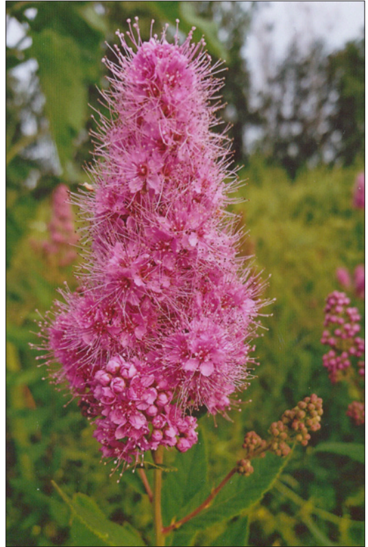
Abb. 5: Spiraea ×billardii agg.: kompakter, pyramidaler Blütenstand. SO Stadtrand Salzwedel, 22.07.2019.