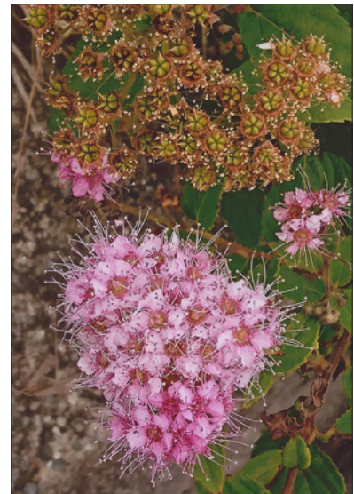
Abb. 8: Spiraea japonica : trugdoldiger Blüten- und Fruchtstand. Pflasterritze im Stadtgebiet von Salzwedel, 22.06.2020.