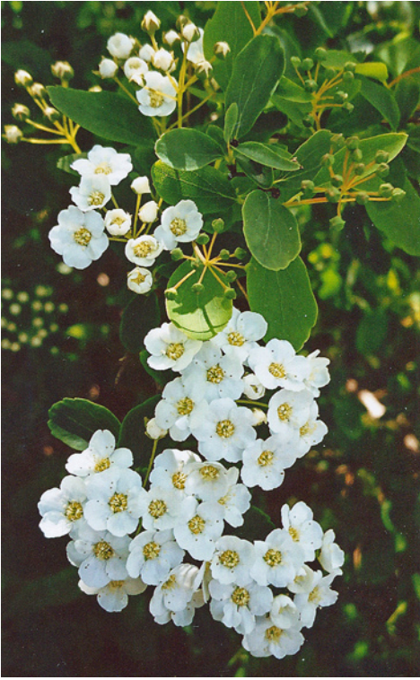
Abb. 9: Spiraea xvanhouttei : trugdoldige Blütenstände an diesjährigen Kurztrieben. Abgrabung SW Chüttlitz, 08.05.2020.

± lang zugespitzt, der Rand grob einfach bis doppelt gesägt, kahl; Blattoberseite kahl, Unterseite auf den Hauptnerven zerstreut behaart; Blattstiel 3 mm lang, verkahlend; diesjährige Triebe braunrot, seicht gerippt, verkahlend.