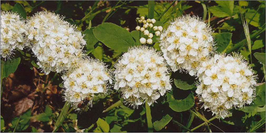
Abb. 6: Spiraea chamaedryfolia : vorjähriger, zickzackartig gewachsener Langtrieb mit trugdoldigen Blütenständen an Kurztrieben. Aufforstungsfläche S Schmölau, 19.05.2021.

nahezu kahl, Rand und Stiel anfangs locker kraushaarig, Unterseite nur auf den Hauptnerven behaart; Blätter der Kurztriebe ähnlich, aber wesentlich kleiner und meist nur einfach gesägt. Auf Verwechslungen mit Spiraea \times vanhouttei ist zu achten, dieser fehlen aber die Ausläufer.