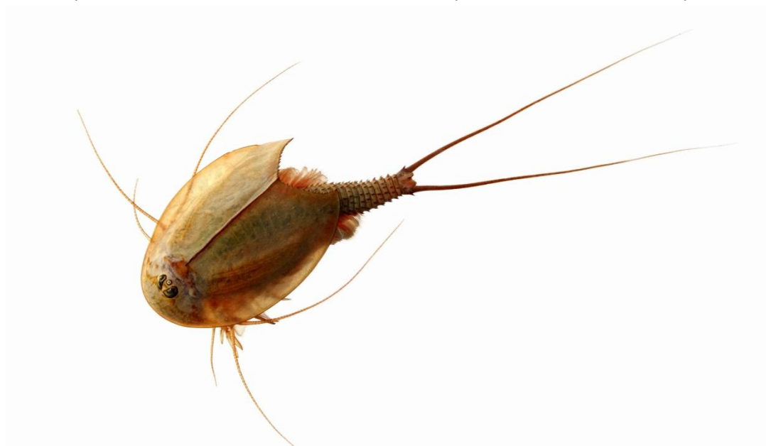
▪ Le Triops ( Triops cancriformis ), une espèce classée "Quasi menacée" en France métropolitaine

Citation des résultats : UICN France & MNHN (2012). La Liste rouge des espèces menacées en France - Chapitre Crustacés d'eau douce de France métropolitaine. Dossier électronique.