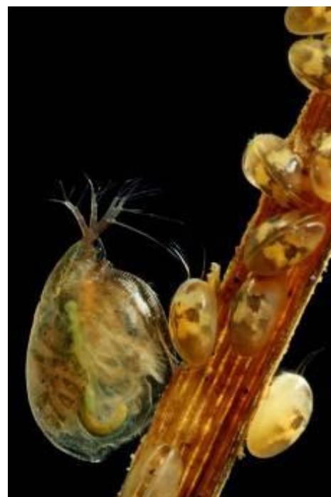
■ L'espèce Simocephalus exspinosus , une daphnie non menacée, accompagnée de quelques ostracodes

Finalement, ce sont donc 576 espèces de crustacés d'eau douce qui ont été passées au crible des critères de la Liste rouge. Les résultats synthétiques sont présentés ci-dessous et la liste des espèces évaluées et de leur catégorie est disponible p. 10 à 22.