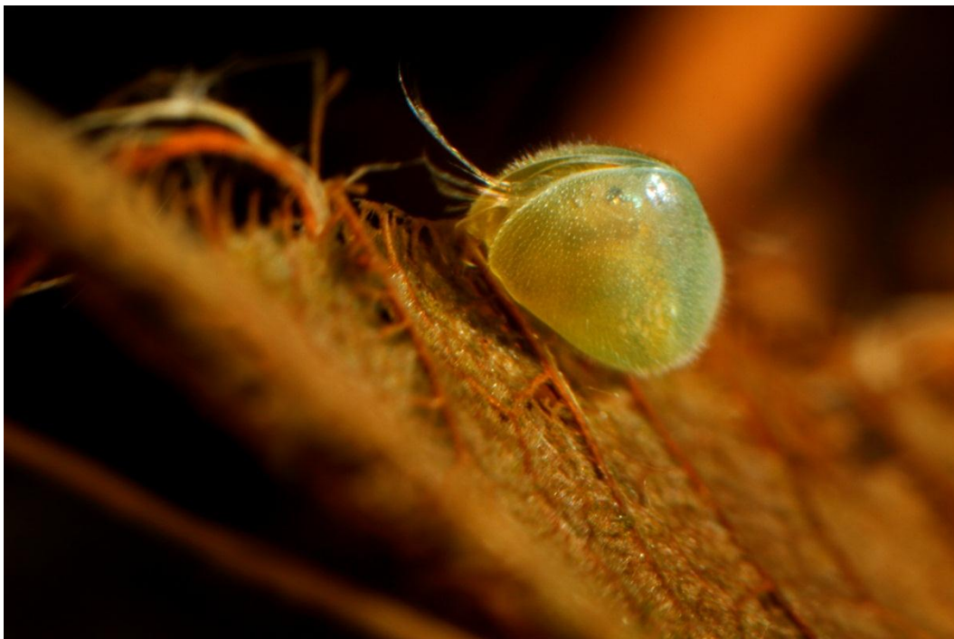
▪ Cypris pubera , une espèce d'ostracode non menacée

Les espèces vivant dans ces milieux interstitiels sont généralement très sensibles aux pollutions des eaux de surface, ainsi qu'aux aménagements des berges et des plaines alluviales. Elles sont donc directement menacées par les interventions humaines le long des cours d'eau.